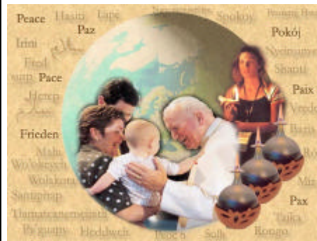
Papst ruft ALLE CHRISTEN auf zum Friedensgebet!!!

Wie schon zu Zeiten des Mose und den vielen anderen Propheten, wird GOTT diesen Götzendienst, des von ihm abgefallenen Volkes, von sich aus zu strafen wissen.